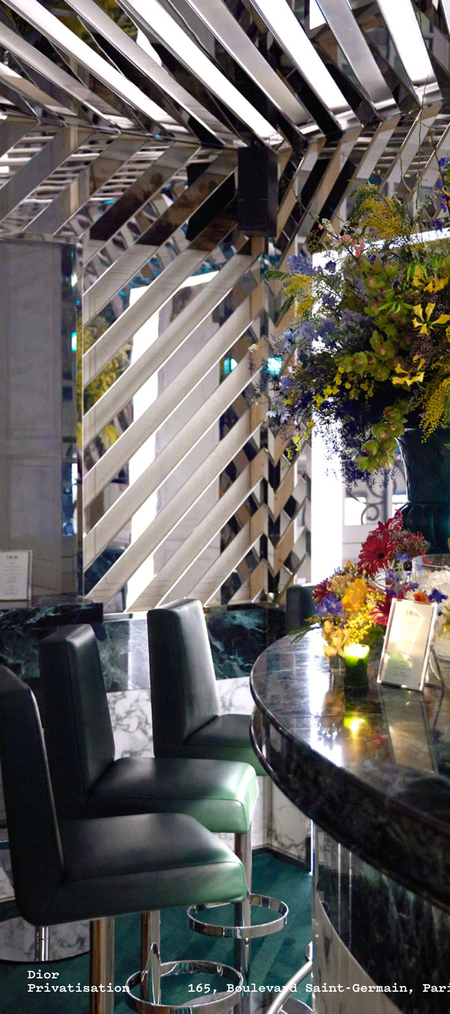
Dior Privatisation 165, Boulevard Saint-Germain, Paris 6